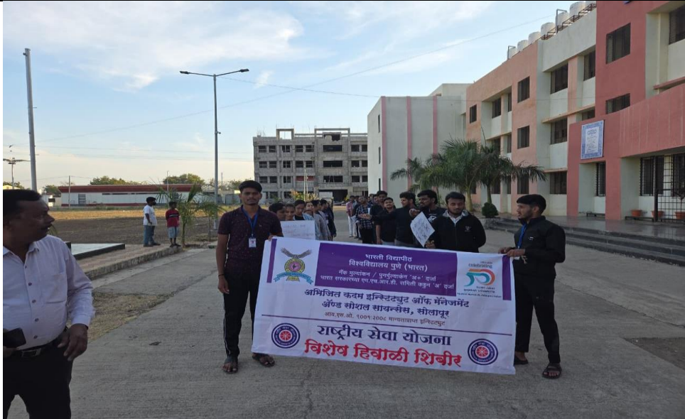
Rally on "Tobacco free Campaign"