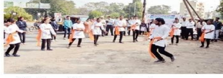
भारती विद्यापीठात आयोजित पथनाट्यातील एक प्रसंग.