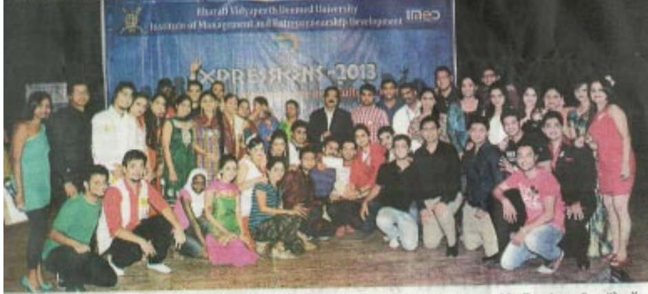
भारती विद्यापीठाच्या 'इन्स्टिट्यूट ऑफ मॅनेजमेंट अॅन्ड अंत्रिप्रुनरशिप डेव्हलपमेंट' च्या आयएमईडीटीफे अंतरराष्ट्रीय मॅनेजमेंट कल्चरल फेस्टिव्हलमध्ये व्यवस्थापन शाखेचे विद्यार्थी.